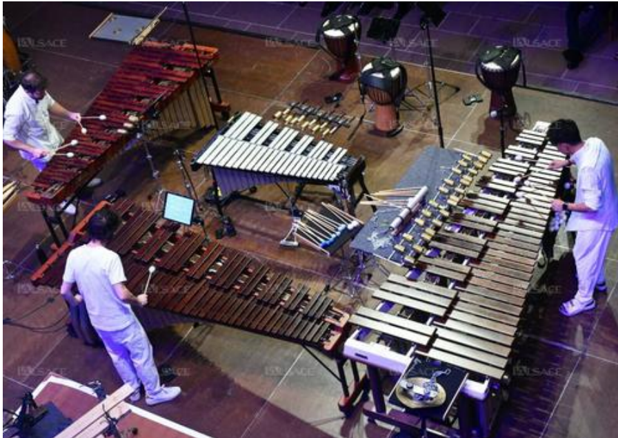
Les Percussions de Strasbourg ont fait la démonstration de leur grande subtilité, vendredi à Colmar.

Le mot “percussions” renvoie au concept de bruit forcément intense et presque dérangeant. Les Percussions de Strasbourg en ont fait la démonstration inverse, tout en subtilité et en douceur, ce vendredi à l’église Saint-Matthieu, dans le cadre du Festival international de Colmar.