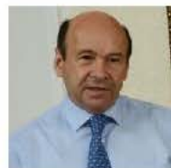
Dominique Meyer.

Dominique Meyer, qui avait en vain demandé un renouvellement de son mandat à la Scala, avait assuré fin mai quitter son poste en toute « sérénité », sans « amertume ». « Un ministre a