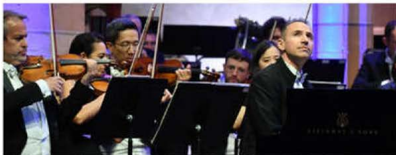
Le pianiste Simon Trpceski a joué le Concerto pour piano et orchestre n°2 de Johannes Brahms.

En conclusion de l'édition 2024 du Festival international de Colmar, l'Orchestre philharmonique de Monte-Carlo s'est produit à deux reprises en cette fin de semaine. La première, samedi soir, a été consacrée à un voyage au cœur de l'Europe centrale autour de pièces de Brahms, Smetana et Dvorak.