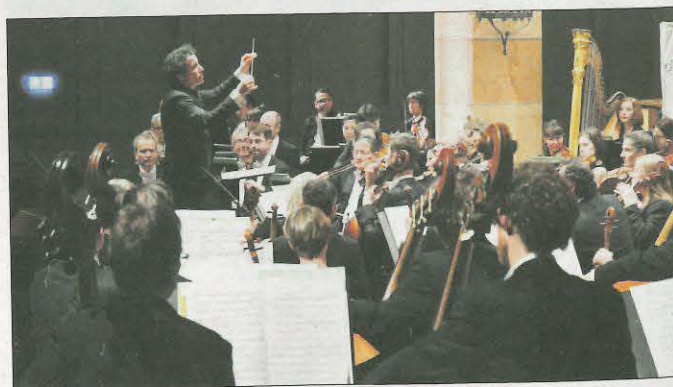
Directeur artistique du festival, Alain Altinoglu dirigera l'Orchestre symphonique de la Monnaie de Bruxelles.

Le Festival international de Colmar a lieu du 5 au 14 juillet.