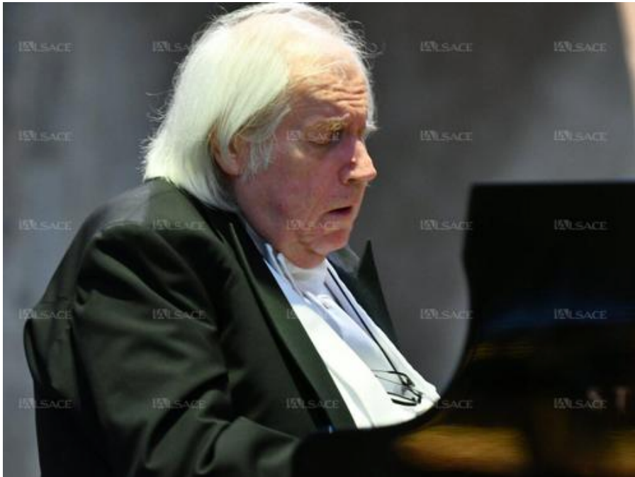
Grigori Sokolov sur la scène de l'église Saint-Matthieu, mardi soir à Colmar.

Enfant chéri depuis près de vingt ans du public du Festival international de Colmar, Grigori Sokolov était en concert mardi soir à Saint-Matthieu. Bach, Chopin et Schumann étaient au menu d'une prestation entre sucré et acide, temps suspendu et moments jubilatoires, fidélité aux textes et instinct de liberté.