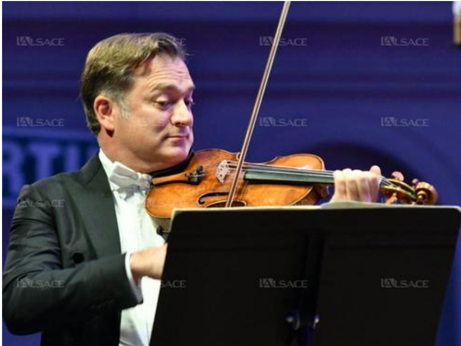
Une nouvelle corde au violon de Renaud Capuçon... la direction d'orchestre.

Invité à plusieurs reprises du festival international de Colmar , Renaud Capuçon y a fait son retour samedi soir... dans un rôle quelque peu différent, ajoutant à ses talents de violoniste la fonction ô combien sensible de chef d'orchestre de la phalange de chambre de Lausanne.