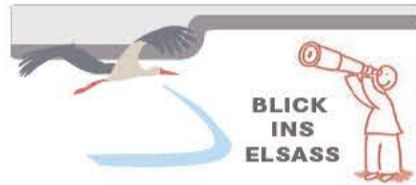
Neues von den Nachbarn

Vor Kurzem wurde Colmars Bürgermeister Straumann zu einer Bewährungs- und Geldstrafe von 3000 Euro verurteilt, da er seinem Büroleiter rückwirkend eine höhere Vergütung zuwies, die allerdings