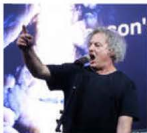
Le groupe colmarien Manson's child faisait plaisir à voir sur la scène de la Loggia, vendredi.

fièrent en interview leur plaisir de jouer précisément sur cette scène de la Plage, « la plus belle scène du festival ». « C'est un p... de kiff que d'être là », confirmait Théo pour débiter le set d'une heure. S'ils sont installés à Strasbourg, les jeunes musiciens sont nés et ont grandi à Belfort. Les trois membres de Caesaria jouaient donc à domicile : le public avait déjà envahi la Plage bien avant le début du concert. Des amis du collège, du lycée venaient avec des pancartes de soutien, rejoins bien vite par un public qui les découvrait. Qui découvrait aussi cette fougue, cette énergie que l'ai-