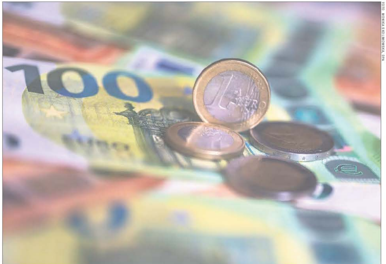
Der Colmarer Bürgermeister Eric Straumann verdient rund ein Drittel weniger als Bürgermeister von vergleichbaren Städten auf baden-württembergischer Seite.

Zum Jubiläum soll es Töpfe in Zitronengelb geben: Die Farbe