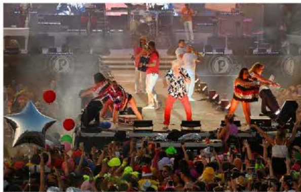
Patrick Sébastien, qui était de la première édition de "Poupet déraillé", il y a dix ans, y a fait son retour l'an dernier.