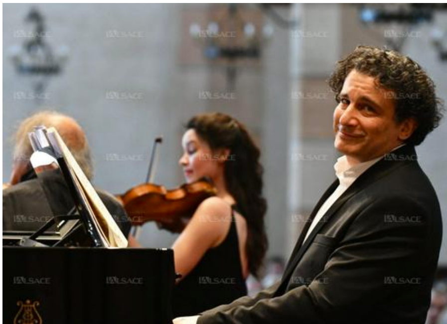
Alain Altinoglu donnera lui-même une master classe de direction d'orchestre le 9 juillet à Colmar.

Le Festival international de Colmar (FIC), dirigé depuis 2023 par le chef d'orchestre Alain Altinoglu, ouvre ses inscriptions aux master classes pour les meilleurs élèves des conservatoires de la région.