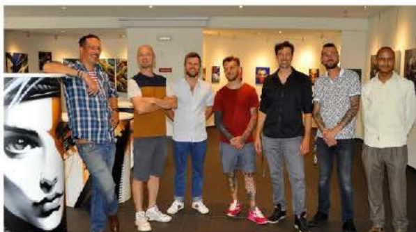
Aussi talentueux qu'Alsaciens, ils sont tous muralistes. Mais débordent du cadre du street-art et se font plaisir, tout l'été, sur les murs de la cave viticole de Ribeauvillé.

Antistatik s'est fait connaître dans le monde du graffiti avec son style futuriste et ses visages structurés et biométriques. Nelson interprète la dimension 3D biomécanique à travers ses arches cosmiques et ses lettrages abstraits, utili-