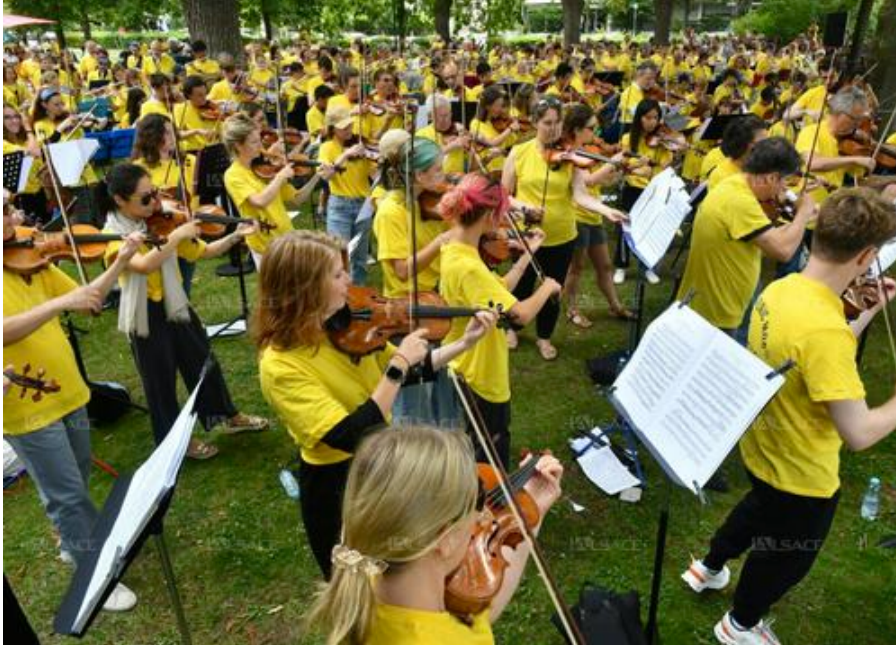
La Colmar Symphonic Mob a réuni 450 musiciens en 2023 sur le Champ-de-Mars.

L'an dernier, le Festival international de Colmar a inauguré la Colmar Symphonic Mob qui a rassemblé des centaines de musiciens de tous niveaux sur le Champ-de-Mars. Une initiative d'Alain Altinoglu, chef d'orchestre et directeur artistique du festival qui a rencontré un franc succès.