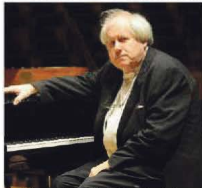
Le pianiste russe Grigory Sokolov interprétera Bach, Chopin et Schumann, « plus une quinzaine de rappels », soupçonne Alain Altinoglu...

C'est un pianiste très attendu à Colmar. Grigory Sokolov interprétera Bach, Chopin et Schumann, « plus une quinzaine de rappels », soupçonne Alain Altinoglu. Place à la musique baroque le 10 juillet avec le célèbre pianofortiste Kristian Bezuidenhout.