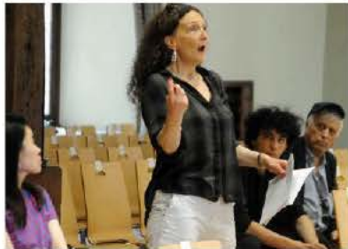
La mezzo-soprano Nora Gubisch a donné, l'année dernière, une master class à des chanteurs lyriques déjà professionnels.

Parallèles des concerts et véritables marqueurs du Festival international de Colmar, les master classes données par des artistes d'excellence sont de nouveau proposées en cette édition 2024.