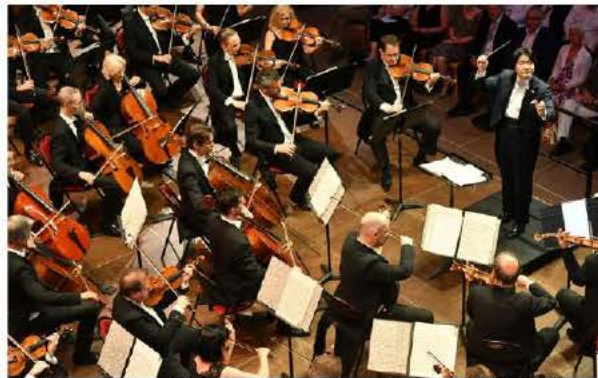
Kazuki Yamada dirigeant l'Orchestre philharmonique de Monte-Carlo à Saint-Mathieu dimanche.

Alors que la formation avait quelque peu déçu ses auditeurs la veille lors d'un concert consacré à la musique d'Europe centrale, Hector Berlioz, Camille Saint-Saëns et Georges Bizet ont trouvé avec cet orchestre et son chef, le virevoltant Kazuki Yamada, des thuriféraires dévoués et en tous points excitants. Après une bien enlevée ouverture d'une suite écrite