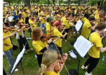
La Colmar Symphonic Mob a réuni 450 musiciens en 2023 sur le Champ-de-Mars.

L'an dernier, le Festival international de Colmar a inauguré la Colmar Symphonic Mob qui a rassemblé des centaines de musiciens de tous niveaux sur le Champ-de-Mars. Une initiative d'Alain Altinoglu, chef d'orchestre et directeur artistique du festival qui a rencontré un franc succès.