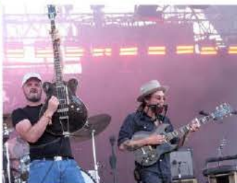
Le groupe sundgauvien Dirty Deep a offert un set puissant et granuleux sur la scène de la Plage.