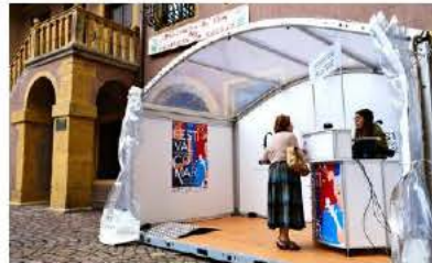
La nouvelle Maison du Festival permet de réserver ses places pour le Festival international de Colmar, et assister quotidiennement à interviews à 14 h 30.

Afin d'être encore plus visible et accessible à tous les publics, l'Office de tourisme de Colmar a créé une Maison du Festival au Koifhus, qui permettra de réserver ses billets, mais également d'assister tous les jours à des interviews à 14 h 30, du 5 au 14 juillet.