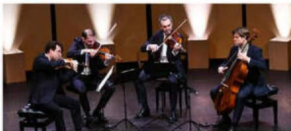
Le quatuor Modigliani sur la scène du théâtre municipal samedi en fin de journée.

Aucune embrouille, une mise en scène identique à celle de toutes les formations semblables, avec un « petit » moins qui fait toujours de l'effet, à savoir l'absence de cravate au cou de ses quatre membres. Mais dès les premières notes une communion se crée entre la scène et le public (venu très nombreux), l'air devient plus léger, les auditeurs se laissent aller, le silence le plus complet règne en maître. Et pourtant les Trois pièces pour quatuor à cordes d'Igor Stravinski, œuvre de la période « Oiseau de feu »/Sacre du printemps « ne sont pas de simples » blues introductives. Si huit minutes suffisent à les faire entendre, ces trois minutes sont comme autant de pièces quasi expérimentales, proches de ce que faisait à la même période (1913-1914) Arnold Schoenberg et ses élèves de