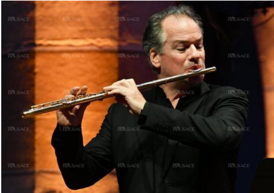
Emmanuel Pahud lors de son concert à Saint-Matthieu jeudi soir.

En quelques notes, le flûtiste Emmanuel Pahud a créé, jeudi à Saint-Matthieu dans le cadre du festival international de Colmar, un climat où le plaisir, la volupté et la bonne camaraderie règnent en maître avec la complicité de trois brillantes cordes du Berliner (Philharmonic).