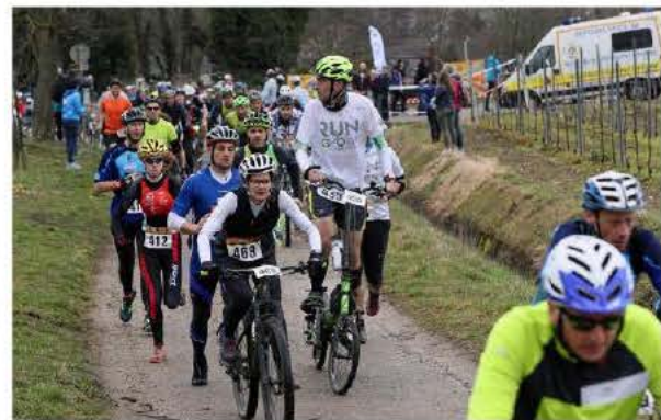
Le 4 e Bike and Run des Trois Châteaux à Eguisheim organisé par le TACC en 2021.

Point de départ fixé à la salle de concert et brasserie colmarienne, le Grillen, partenaire de la course. « Avec le complexe à proximité, le public pourra facilement se garer », ajoute la coprésidente. À 9 h 30, les Colmariens pourront prendre le départ pour le format Sprint, un défi de