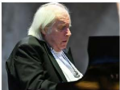
Grigori Sokolov sur la scène de l'église Saint-Matthieu, mardi soir à Colmar.

Enfant chéri depuis près de vingt ans du public du Festival international de Colmar, Grigori Sokolov était en concert mardi soir à Saint-Matthieu. Bach, Chopin et Schumann étaient au menu d'une prestation entre sucre et acide, temps suspendu et moments jubilatoires, fidèle aux textes et instinct de liberté.