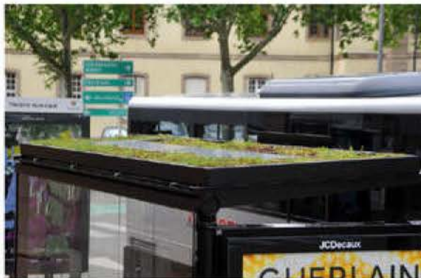
Sur 47 des 228 nouveaux abris, le tapis de mousse végétale capte et absorbe les polluants. Comme ici, à côté du théâtre à Colmar.

En détail, « la mousse résistante et dépourvue de racines se nourrit des particules dans l'air pour se développer naturellement. Ce dispositif est complété par une ventilation intégrée à la toiture de l'abri, qui aspire l'air au travers de la couche végétale et le diffuse vers les usagers sous l'abri. Avec un système de pilotage intelligent, les ventilateurs se déclenchent en cas de pic de