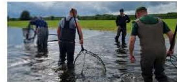
Une deuxième opération de sauvetage des carpes était organisée ce mardi à Hoerdt.

L'Appma (association agréée pour la pêche et la protection du milieu aquatique) Hoerdt-Bietenheim, au nord de Strasbourg, mène depuis lundi des opérations de sauvetage de carpes. Suite à la crue de la Zorn en fin de semaine dernière, les poissons d'eau douce, guidés par leur instinct naturel, sont sortis de la rivière pour aller frayer en toute tranquillité dans les prés, où se sont formées de grandes étendues d'eau pouvant atteindre un mètre de profondeur. Pour éviter qu'elles ne se retrouvent prisonnières de ces refuges précaires et meurent d'épuisement, des membres de l'association de pêche, aidés de chasseurs et de riverains, ont volé à leur secours durant le lundi de Pentecôte. Une même opération a été organisée ce mardi. En tout, une cinquantaine de carpes et brèmes ont été remises en rivière.