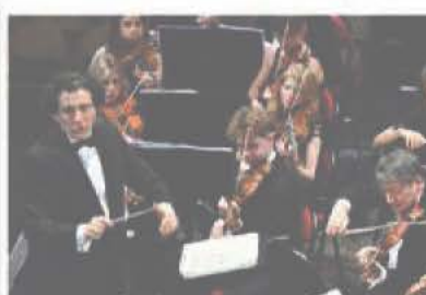
Premier festival de musique pour Alain Altinoglu, nouveau directeur artistique.

Le programme de ce rendez-vous musical incontournable, prévu du 5 au 14 juillet, sera dévoilé le 13 février et la billetterie ouverte le 14. « Une belle et éclectique programmation nous attend ! » Valori-