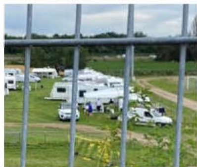
Des dizaines de caravanes se sont une fois de plus installées sur les deux pelouses d'entraînement, situées derrière le terrain d'honneur de la rue Ampère.