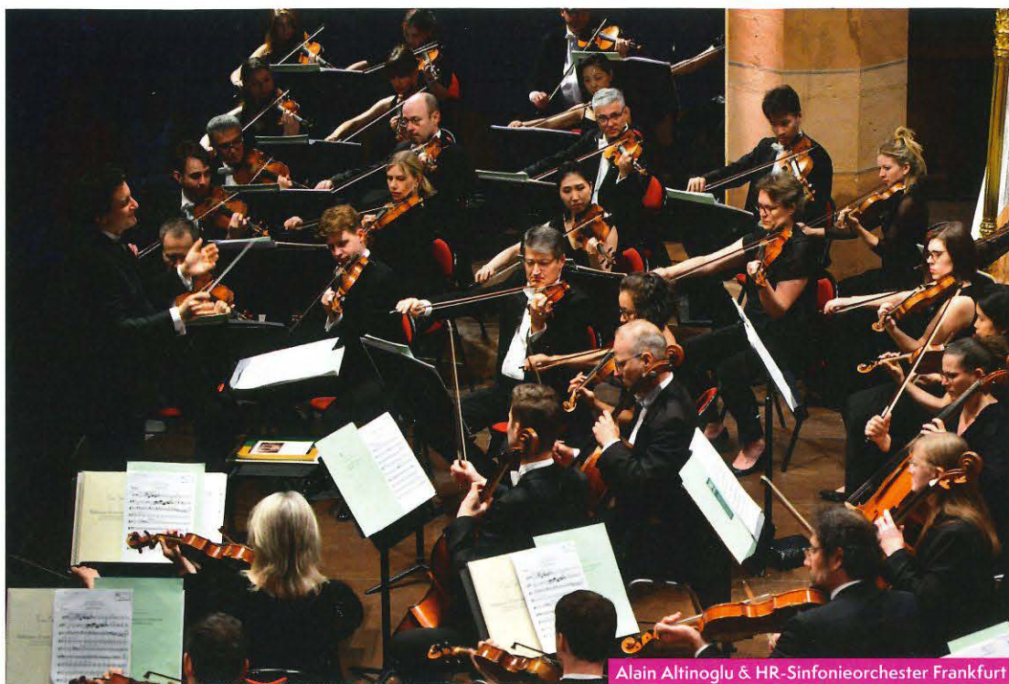
Alain Altinoglu & HR-Sinfonieorchester Frankfurt