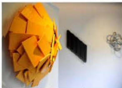
Les lattes de bois de Rainer Gross sont peintes et assemblées de manière très complexe. Des combinaisons qui éclairent sur l'extrême dextérité de l'artiste.

Rainer Gross est de retour à Colmar. À la galerie Murmure jusqu'au 7 septembre, il expose des œuvres issues de ses installations monumentales, élaborées dans toute l'Europe. Mais aussi quelques nouveaux travaux où, comme toujours, courbes et droites se confrontent.