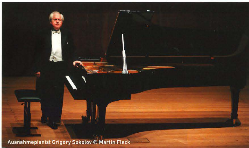
Ausnahmepianist Grigory Sokolov

Geiger Capucon und Pianist Sokolov zu Gast im Elsass