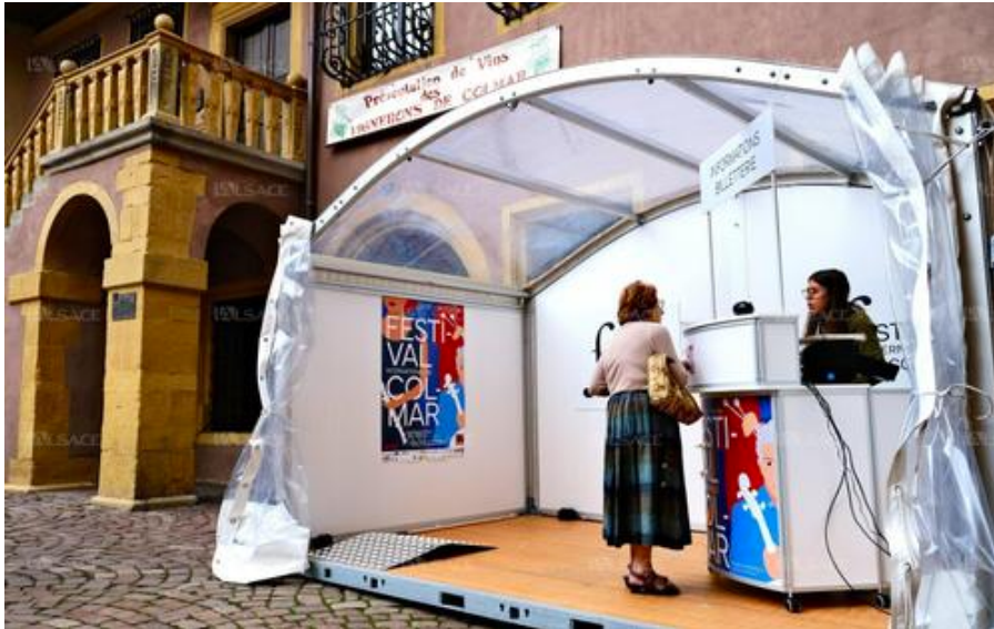
La nouvelle Maison du Festival permet de réserver ses places pour le Festival international de Colmar, et assister quotidiennement à interviews à 14 h 30.

Afin d'être encore plus visible et accessible à tous les publics, l'Office de tourisme de Colmar a créé une Maison du Festival au Koïfhus, qui permettra de réserver ses billets, mais également d'assister tous les jours à des interviews à 14 h 30, du 5 au 14 juillet.