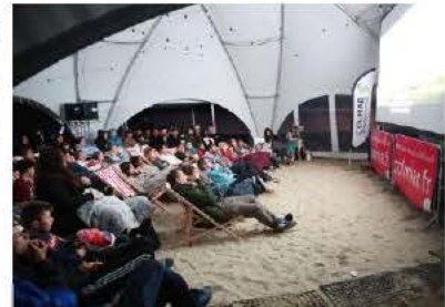
140 spectateurs ont assisté à la première séance de cinéma de plein air pour voir Les Dents de la mer à la Base nautique, ce samedi 6 juillet.

Les prochaines séances : Qu'est-ce qu'on a fait au Bon Dieu ?, samedi 20 juillet vers 22 h dans la cour de l'école Pfister ; La troisième édition de Seize neuvième, la soirée du clip musical, samedi 10 août sur le parking du Grillen ; Les Troils, samedi 24 août vers 21 h à la Plaine-Pasteur (à côté du kiosque).