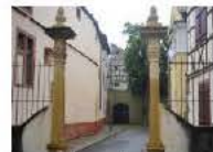
De quoi donner du baume au cœur des amoureux du patrimoine de la ville.

Ça n'est quasiment plus qu'un mauvais souvenir. Endommagée involontairement par le fourgon d'une entreprise en décembre dernier (notre édition du 18 janvier 2024), une colonne dorique faisant partie du très beau portail en fer forgé du XVII e siècle située petite rue des Blés à Colmar, a été restaurée à l'identique et remise en place ces jours-ci.