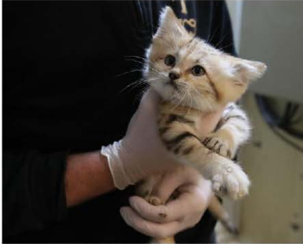
Un des trois mâles de chats des sables nés le 8 février au zoo de Mulhouse.

« C'est une mère très calme et en confiance qui, dès sa première portée, s'est très bien occupée de ses petits », souligne avec satisfaction Benoit Quintard, directeur adjoint du zoo, qui a pucé et vacciné les trois jeunes chats, ce mardi 9 avril.