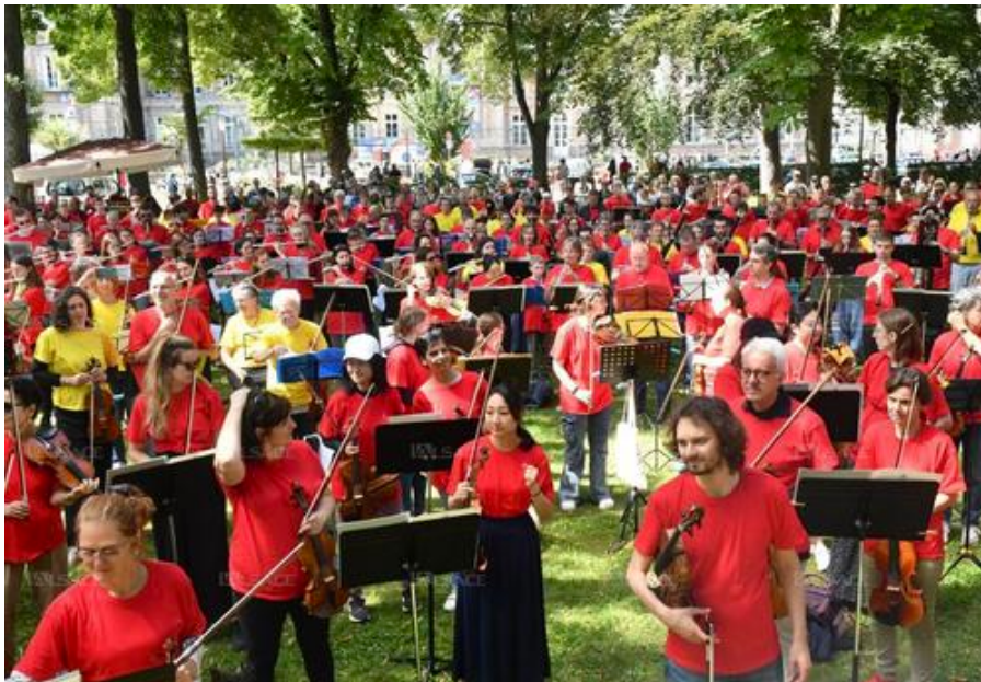
Violons, violoncelles, contrebasses (etc.) à perte de vue !

Jusqu'au cœur de la nuit, l'inquiétude était sans doute palpable chez les responsables du Festival international : la Symphonic mob© prévue ce dimanche matin au Champ de Mars aura-t-elle lieu sous un ciel lumineux... ou bien faudra-t-il l'annuler pour cause d'averse ? Peu après 9 heures 400 musiciens étaient bien en place pour une unique répétition d'ensemble.