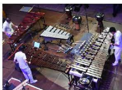
Les Percussions de Strasbourg ont fait la démonstration de leur grande subtilité, vendredi à Colmar.

Les « invariants » de ce dernier, joués sur marimbas et vibraphones, renvoient à la notion de tempérament stable qui soutient la composition musicale depuis l'époque baroque : l'œuvre «essai» d'explorer ce concept de constance et de stabilité dans une écriture contemporaine avec mélodies douces et répétitives, bruissements sourds et jeux infinis sur les so-