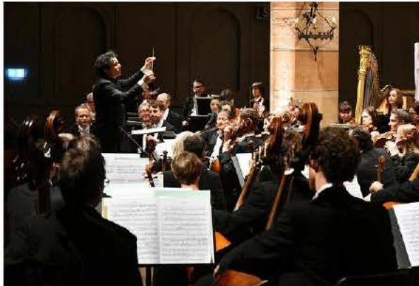
L'Orchestre symphonique de la radio de Francfort lors du concert à Saint-Matthieu, dirigé par Alain Altinoglu, le nouveau directeur artistique du Festival international de musique depuis l'été dernier.

Dix concerts de prestige à l'église Saint-Matthieu à 20 h 30, sept concerts de musique de chambre au théâtre municipal à 18 h, cinq concerts « Jeunes talents » au Koifhus à 12 h 30... mais également un concert « famille » à 11 h sobrement intitulé « Concerto pour une violoniste bavarde et un vidéo-projecteur » et l'Incontournable Colmar Symphonic Mob®