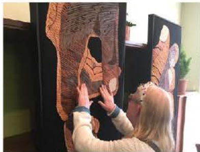
Découverte tactile d'une œuvre

Les locaux de l'association C'cité fédération des aveugles, situés rue du Rempart à Colmar, accueillent depuis vendredi un florilège d'œuvres récentes de l'artiste Jean-François Demay. Conçues en grand format, en cuir de récupération sur un fond textile, elles proposent une nouvelle manière d'interagir avec l'art en éveillant tous les sens des visiteurs.