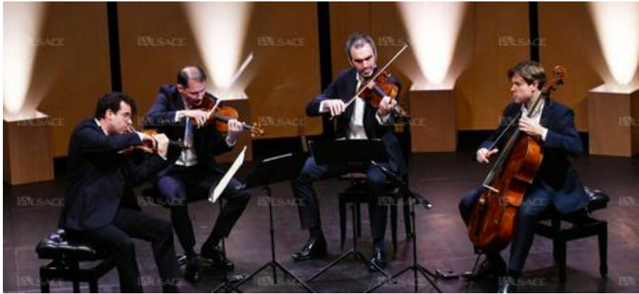
Le quatuor Modigliani sur la scène du théâtre municipal samedi en fin de journée.

Présent sur la scène du théâtre dans le cadre du Festival international de Colmar près de dix ans après sa première prestation, le quatuor Modigliani a donné ce samedi un concert en tous points parfaits, justifiant amplement une affirmation médiatique apparue il y a peu : « le quatuor dont tout le monde parle ! »