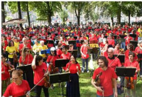
Violons, violoncelles, contrebasses (etc.) à perte de vue !

Aux 70 ou 80 musiciens de l'Orchestre de la Monnaie de Bruxelles qui étaient en concert vendredi et samedi soir à Saint-Mathieu, se sont adjoints en début de matinée près de 350 amateurs, qu'ils soient élèves d'écoles de musique, de conservatoires, ou simples pratiquants réguliers ou non ? Ils étaient ainsi une bonne centaine de violonistes, plusieurs dizaines de trompettistes dont la benjamine à tout juste huit printemps, pléthore de cornistes, de trombonistes et de violoncellistes, une bonne dizaine de