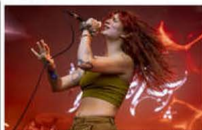
Gel a ouvert cette troisième journée des 34 es Eurockéennes où artistes et festivaliers ont vaincu la pluie et la boue.

Affluence record Pendant ce temps, l'équipe du festival dressait déjà le bilan d'une édition record pour la formule mise en place depuis 2022 (trois jours classi-