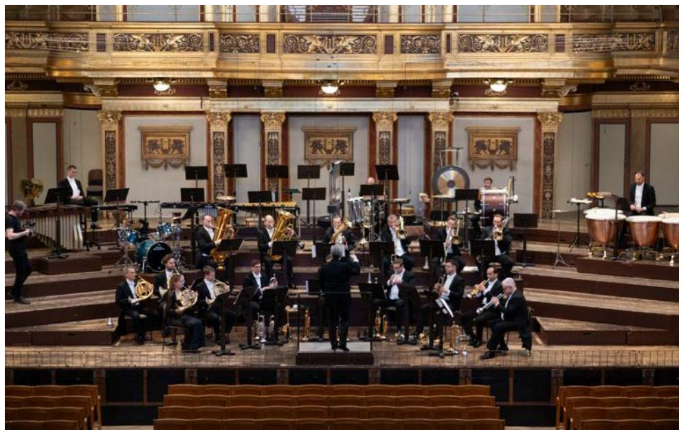
Le Philharmonic Brass qui réunit les cuivres de deux orchestres de Berlin et de Vienne jouera le 8 juillet.

Voici maintenant le navire amiral du festival, les concerts prestige, 20 h 30 en l'église Saint-Mathieu Le premier rendez-vous eux sera placé sous la baguette d'Alain Altinoglu à la tête de l'orchestre symphonique de l'opéra de la Monnaie de Bruxelles, l'une des deux formations qu'il dirige avec Francfort. Et en toute logique, le concert sera lyri-