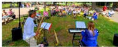
Il faisait bon être au Champ de Mars ce dimanche, et sommeiller sur les transats avec Harmony Jazz Events.