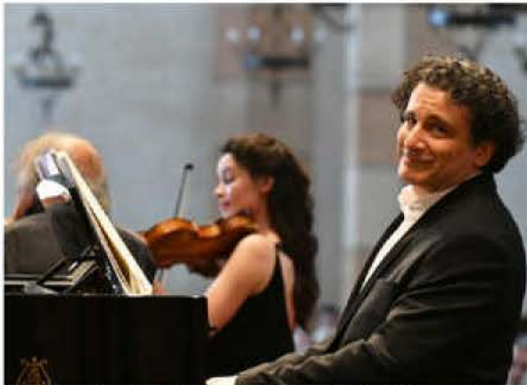
Alain Altinoglu donnera lui-même une master class de direction d'orchestre le 9 juillet à Colmar.