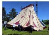
Le grand chapiteau a été dressé cette semaine.

Le grand théâtre éphémère a ouvert ses portes au centre hospitalier d'Erstein. Il servira de support à de nombreux spectacles jusqu'au samedi 1 er juin (où le duo d'artistes Igor Sellem-Julia Moa Caprez donnera son Concerto pour deux clowns sous un grand chapiteau dressé pour l'occasion). Pour les organisateurs, il s'agit d'ouvrir l'hôpital psychiatrique sur la ville et d'attirer de nouveaux publics vers la culture. Plusieurs animations ont été proposées le week-end dernier. Des apéros-concerts et spectacles pour enfants seront également proposés. Apéros-concerts gratuits. Renseignements et billetterie pour les spectacles au 03 88 64 53 85 ou à l'adresse culture@ville-erstein.fr .