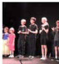
Les plus jeunes élèves comédiens du Cerac sur la scène du Grillen.

L'après-midi était émaillé et dédié au théâtre samedi au Grillen, avec la restitution annuelle des élèves comédiens du CERAC (Centre d'enseignement et de recherche artistique de Colmar). Depuis la découverte du théâtre lui-même, en passant par l'apprentissage de texte, de la manière d'insuffler des émotions, d'adopter des postures, le centre s'adresse à des amateurs de 7 à 77 ans avides de monter sur les planches. Et ils sont tous là. Les premiers à fouler les planches ont effectivement de 7 à 9 ans et déclinent une version réécrite à partir d'improvisations de La Belle au bois dormant , costumes à l'appui. De petites saynètes se suivent avec délicatesse jusqu'au réveil de la Belle en question. Les collégiens (trois garçons et les trois filles) vont offrir un travail tournant autour de thématique de la mort, un sujet qui reviendra une fois encore sur la scène avec les acteurs les plus âgés un peu plus tard. Seront également convoqués Molière (quelques extraits du Malade imaginaire et de L'écou-