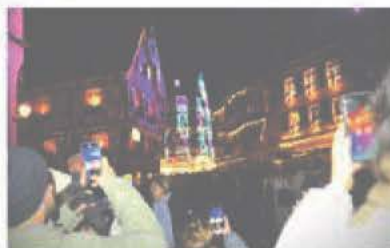
Safari-photo devant le Roiflous. Des vues que l'on retrouve souvent sur Instagram ou sur TikTok.

D'estimer cet impact économique global. Selon une étude réalisée par le cabinet indépendant EMC en 2019, le taux de consommation touristique