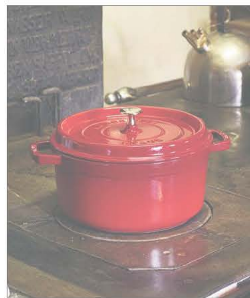
Die gusseisernen Kochtöpfe aus dem Elsass werden mittlerweile international vertrieben.

Die „Opéra national du Rhin“ aus Straßburg führt am Samstag, 20. April, um 20 Uhr, das Broadway-Musical „The Fantasticks“ von Tom Jones im Kulturzentrum Art'Rhena auf der Rheininsel auf. Das Musical wird in französischer Sprache dargeboten, doch Songs, wie „Try to remember“ dürften zum Mitsummen sein. Eintritt 15 Euro pro Person. Tickets gibt es online unter billetterie.artrhena.eu hmv