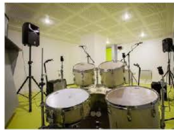
Le studio «vert» est une des trois salles ouvertes aux groupes en répétition.

Les Bains Rock fêtent leurs dix ans. Les studios haguenois, gérés par le Réseau Jack, ont été inaugurés le 21 juin 2014, jour de la Fête de la musique, dans les anciens bains municipaux entièrement réaménagés. Douches et baignoires ont fait place à trois studios de répétition et d'enregistrement équipés.