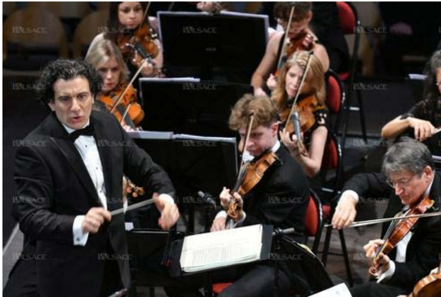
Premier festival de musique pour Alain Altinoglu, nouveau directeur artistique.

Colmar fête le printemps, qui se déroulera du 28 mars au 21 avril, ne connaîtra pas de gros changements. « C'est un format qui a trouvé sa cadence », considère le président. « Nous lui conservons son sens qui est d'être lié à la fête de Pâques », ajoute la directrice. Les acteurs du tourisme continuent à s'engager en faveur de la mobilité douce aux côtés de l'Alsace Essentielle.