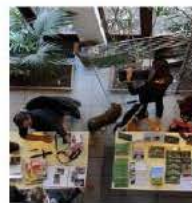
Le salon De la Nature du livre reviendra en novembre, les inscriptions sont ouvertes jusqu'au 31 août.

Le but est de présenter au public les nouveautés parues dans ce domaine. Ne sont donc admis que les livres récents et n'ayant pas encore été présentés lors d'une précédente édition de ce