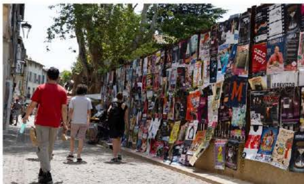
Écoresponsable, le festival Off d'Avignon a limité le nombre d'affiches à coller par compagnie à 150 et le nombre de flyers à distribuer au public à 5 000.

Plus que jamais, la chronique festivalière a été animée par l'actualité politique immédiate. Sur scène et dans les rues, et même la nuit, celle du 4 au 5 juillet dans la cour d'honneur du Palais des papes. Une vraie nuit d'union, de mobilisation populaire à l'appel de l'ensemble des syndicats. Une pluie de cendres s'était abattue sur Avignon en 2022, à la suite d'incendies aux abords des voies ferrées. L'embrasement de cet été 2024 a été politique. Face au risque d'accession du Rassem-