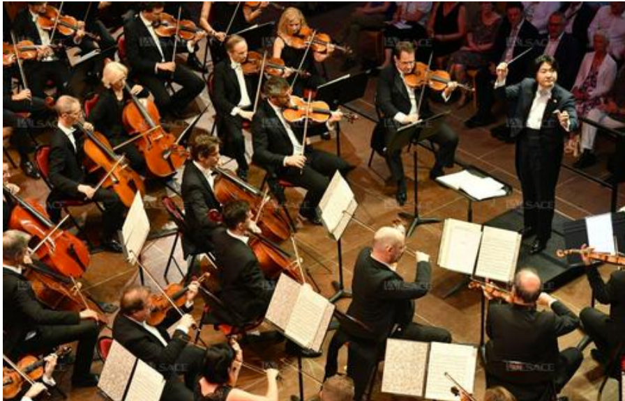
Kazuki Yamada dirigeant l'orchestre philharmonique de Monte-Carlo à Saint-Matthieu dimanche.

Invité par le festival international de Colmar pour les deux soirées conclusives de la 43 e édition de la manifestation à Saint-Matthieu, l' orchestre philharmonique de Monte-Carlo a offert dimanche après-midi un goûteux feu d'artifice autour de grands noms de la musique française du XIX e et du début du XX e siècles.